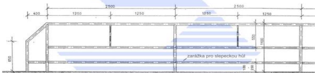
Obrázek 5 – Schéma silničního (dopravně bezpečnostního) zábradlí s výplňovým prutem a zarážkou pro slepeckou hůl